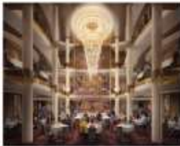
MAIN DINING ROOM

Royal Caribbean offers a myriad of casual dining options and quick bites for meals on the run.