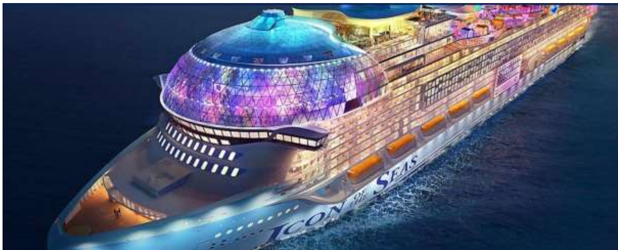
QQCRMIA-RC025 – Icon Of The Seas - “ Western Caribbean & Perfect Day” 8 วัน7 คืน Miami