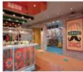
EL LOCO FRESH