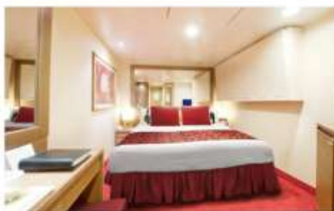
DELUXE INTERIOR DECK 5-11 Fantastica