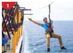
1 Ropes Course & Zipline Feel the thrill of gliding above the ocean on a 35-metre zipline.