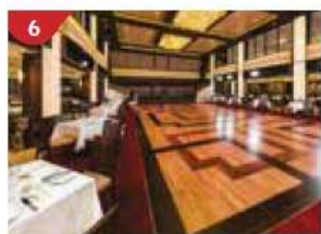
6 Dream Dining Room Savour a variety of international cuisines.