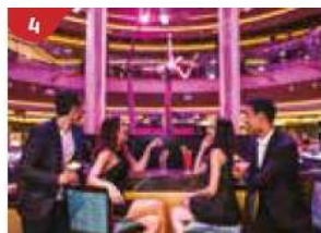
4 Bar 360 Catch live music and aerial acrobatic performances with a glass of champagne.