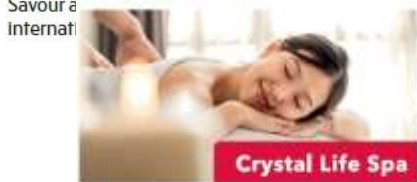
Crystal Life Spa