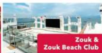
Zouk & Zouk Beach Club