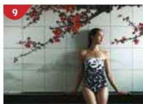
9 Crystal Life™ Spa Relax and rejuvenate at the Crystal Life Spa.