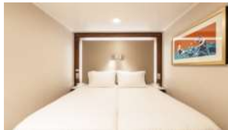
พัก 1-2 ท่าน

From 13 - 14 sq.m Max Occupancy 2-4 + Deck 5/8/9/10/11/12/13/15 2 Single Beds / 2 Single Beds + 1 Ceiling Pullman Bed / 1 Single Bed + 1 Pullman Bed + 1 Double Sofa Bed