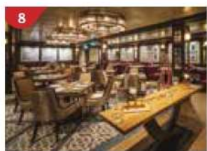
8 Bistro By Mark Best Enjoy fine dining at the Bistro By Mark Best.