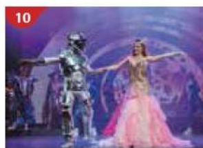
10 Zodiac Theatre Watch a performance at the Zodiac Theatre.