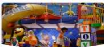
Disney's Oceaneer Club

วันนี้เรือสำราญ Disney Adventure จะล่องอยู่บนน่านน้ำสากลตลอด2วัน ท่านสามารถสนุกสนานพักผ่อนอยู่บนเรือสำราญที่มีกิจกรรมมากมาย ทั้งสวนสนุกทั้ง 7 โซน ร้านอาหารธีม Disney และ Marvel ร้านขายของที่ระลึก ชมการแสดงจากหลายเวที แลพะกิจกรรมอีกมากมายทั่วทั้งเรือสำราญ