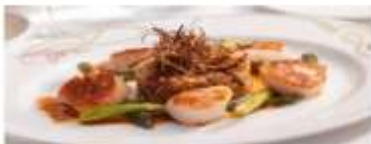
Main Dining Disney's Rotational Dining lets you "rotate" to one of 3 restaurants, while your servers follow you from venue to venue. View More