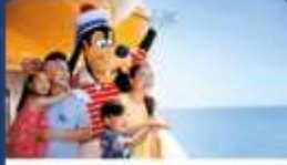
มิกกี้เมาส์และผองเพื่อน

ตัวละครที่ชื่นชอบเรือเช่นกัน! หมินนี่ หักท่าย โทสตา หรือขอลายเซ็นจากตัวละครโปรดจากดิสนีย์ พิกซาร์ และมาร์เวล อย่างไรก็ตามคอตังเกดมิคก็เนาส์และห้องเพื่อนของเขา ระหว่างการมาเยือนแบบเซอร์ไพรส์และโบสถานที่กำหนดไว้ทั้งหมด