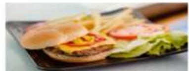
Casual Dining Savor a wide range of fresh food items and mouthwatering delicacies for dinner. View More