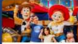
เพื่อนพิกซาร์