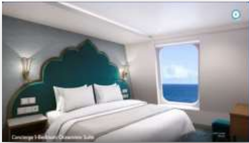
Concierge Family Oceanview Suite