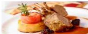
Adult-Exclusive Dining Enjoy romantic dinner destinations that cater exclusively to adults looking for fine dining amid an elegant atmosphere. View More