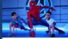
เหล่าซูเปอร์ฮีโร่และวายร้ายจากมาร์เวล