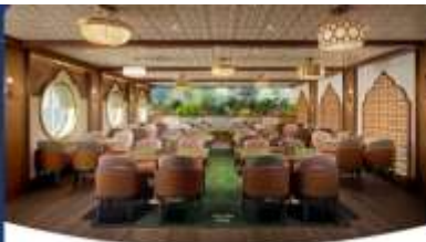
Gramma Tala Kitchen