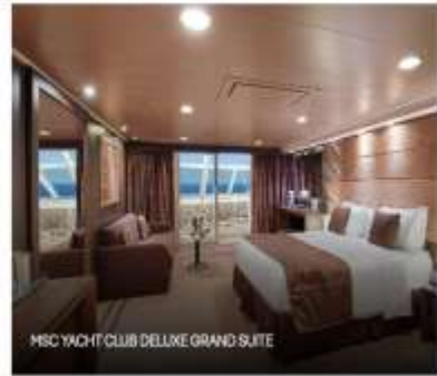
MSC YACHT CLUB DELUXE GRAND SUITE