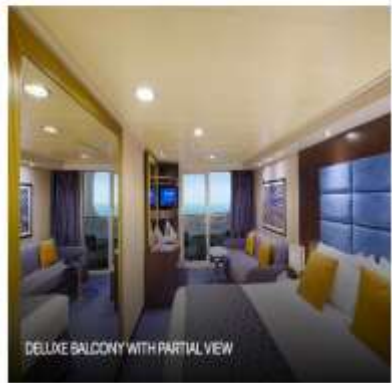
DELUXE BALCONY WITH PARTIAL VIEW