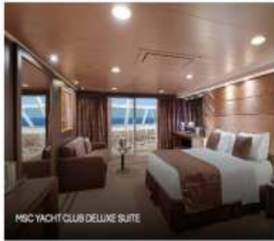
MSC YACHT CLUB DELUXE SUITE