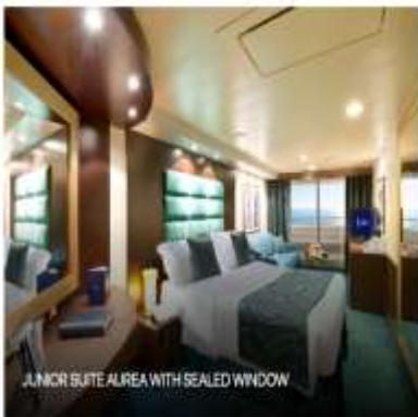
JUNIOR SUITE AIREA WITH SEALED WINDOW