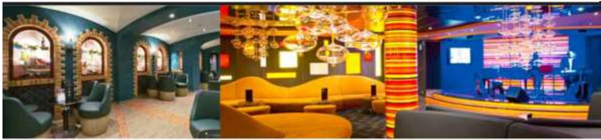
LA CANTINA DI BACCO