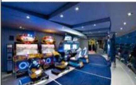
VIDEO GAMES ARCADE