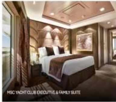
MSC YACHT CLUB EXECUTIVE & FAMILY SUITE