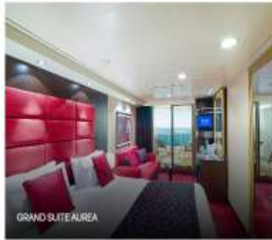
GRAND SUITE AIREA