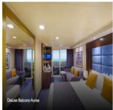
Deluxe Balcony Airea