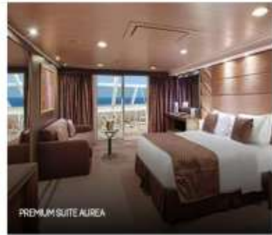
PREMIUM SUITE AIREA