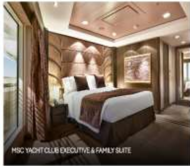
MSC YACHT CLUB EXECUTIVE & FAMILY SUITE