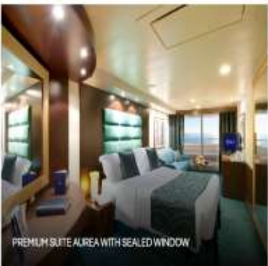
PREMIUM SUITE AIREA WITH SEALED WINDOW