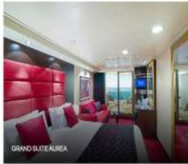
GRAND SUITE AIREA