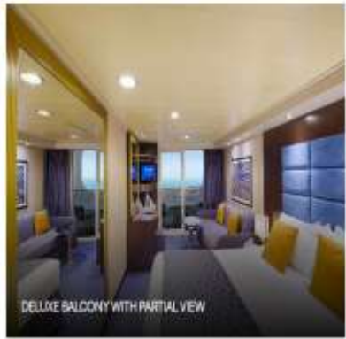
DELUXE BALCONY WITH PARTIAL VIEW