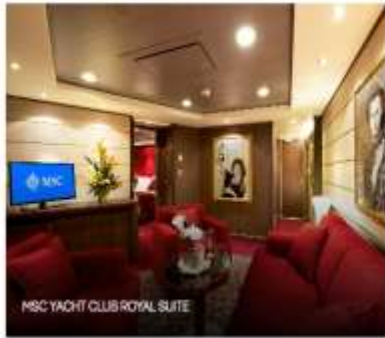
MSC YACHT CLUB ROYAL SUITE