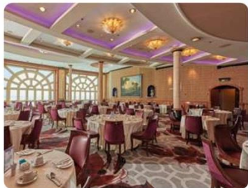
Dream Dining Room

รับประทานอาหารกับครอบครัวในบรรยากาศที่น่าดึงดูดใจทั้งอาหารตะวันตก ยอดนิยม เช่น สเต็ก เนื้อ หมู ไก่ แซลม่อน ซีฟู้ด และเมนูอาหารจีนหลากหลาย ซึ่งผลัดเปลี่ยนหมุนเวียนไม่ให้อ膩 บริการท่านแบบไม้อั้น