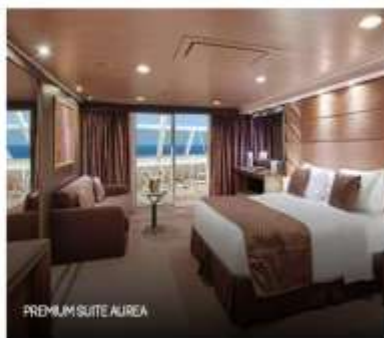
PREMIUM SUITE AIREA