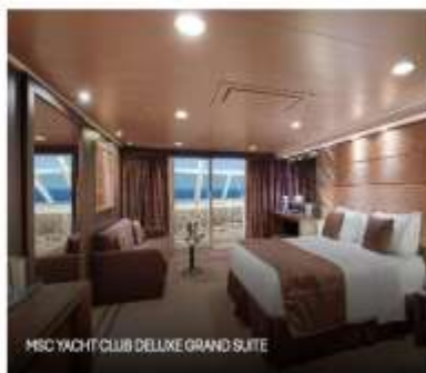
MSC YACHT CLUB DELUXE GRAND SUITE