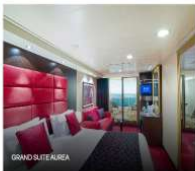
GRAND SUITE AIREA