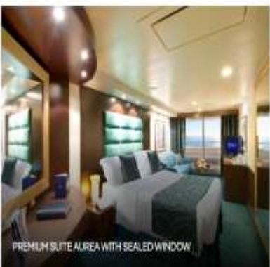
PREMIUM SUITE AIREA WITH SEALED WINDOW