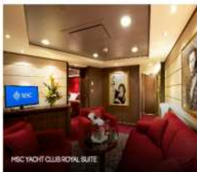
MSC YACHT CLUB ROYAL SUITE