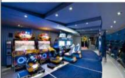
VIDEO GAMES ARCADE