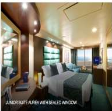
JUNIOR SUITE AIREA WITH SEALED WINDOW