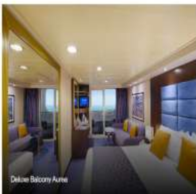
Deluxe Balcony Airea