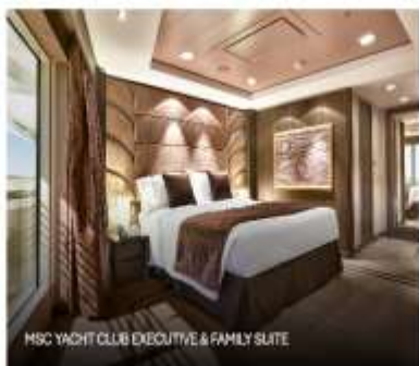
MSC YACHT CLUB EXECUTIVE & FAMILY SUITE