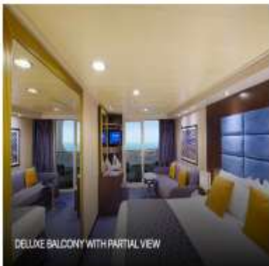
DELUXE BALCONY WITH PARTIAL VIEW