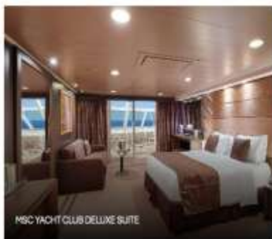
MSC YACHT CLUB DELUXE SUITE