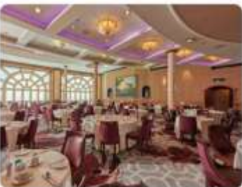
Dream Dining Room