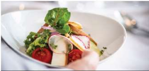
BREAKFAST, LUNCH & DINNER

On an Avalon river cruise, great food is all part of the journey with all meals on board included. Our talented chefs use the freshest local ingredients to