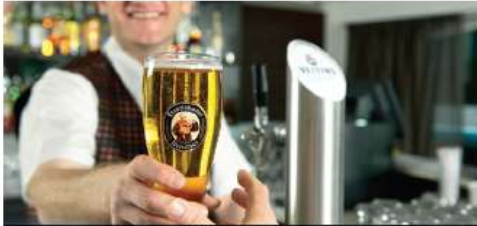
HAPPY HOUR EVERY DAY

Whether you're in the mood for an elegant four-course dinner in the glass-walled Panorama Dining Room, or a casual lunch in the new Panorama Bistro