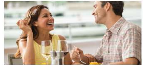
ALTERNATIVE DINING OPTIONS

Red, white, rosé and regional wines as well as local beers are served throughout lunch & dinner, and complimentary is available with breakfast and