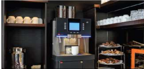
COFFEE & TEA MAKING STATION

Enjoy a drink with newfound friends - serving premium spirits, wines, beers and cocktails at reduced prices. Why not try a cocktail from the extensive Active & Discovery™-inspired bar menu?