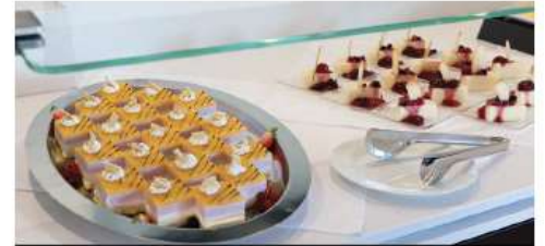
AFTERNOON TEA & TASTINGS

The Club Lounge offers specialty coffees around the clock, as well as a range of teas and cookies - all complimentary! (Also available in the Panorama Lounge).