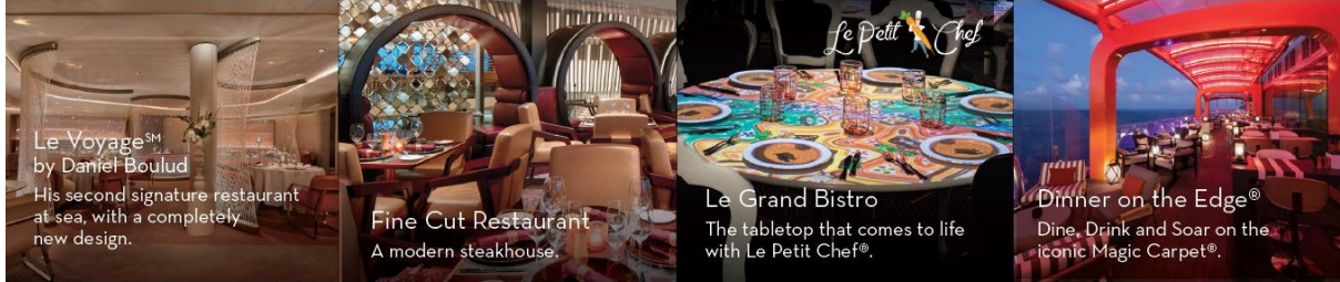
Le Voyage SM by Daniel Boulud His second signature restaurant at sea, with a completely new design.