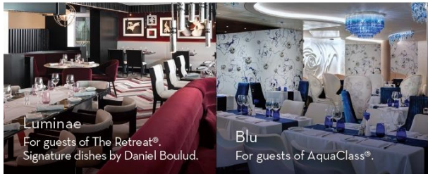
Luminae For guests of The Retreat ® . Signature dishes by Daniel Boulud.