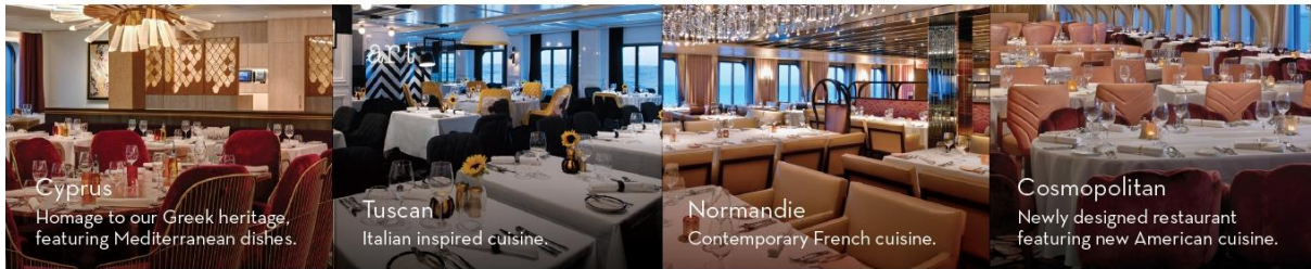
Cyprus Homage to our Greek heritage, featuring Mediterranean dishes.