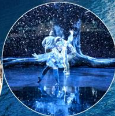
Entertainment on Ascent