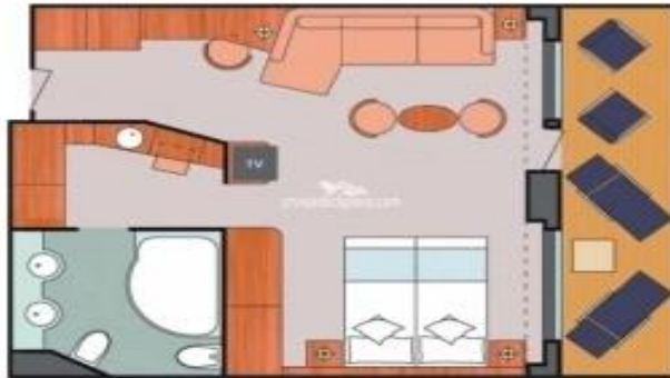
Grand Suite Sleeps up to: 4 10 Staterooms Cabin: 456 sqft (43 m 2 ) * Size may vary, see details below.