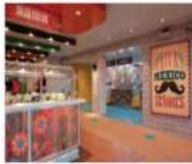
EL LOCO FRESH