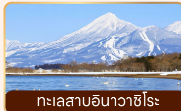
ทะเลสาบอินาวาชิโระ