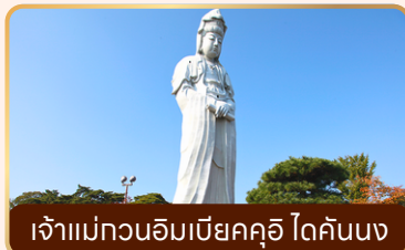
เจ้าแม่ทวนอิมเบ็ญคคุอิ ไดคันนง