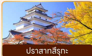
ปราสาทสิริรุกะ