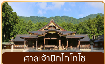
ศาลเจ้านิทโทโทโซ