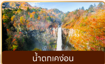
น้ำตกเคงอน