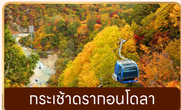
กระเช้าดรากอนโดลา