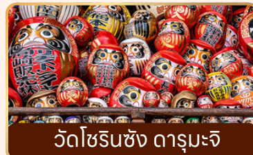
วัดโชรินซัง ดารุมะจิ