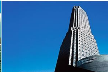
▶ CERULEAN TOWER TOKYU HOTEL

สามารถชมทัศนียภาพ Tokyo Sky Tree และสัมผัสกลิ่นอายสมัย Edo ย่าน Asakusa ได้