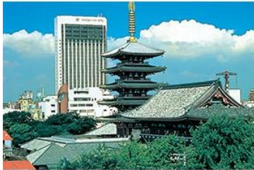
▶ ASAKUSA VIEW HOTEL