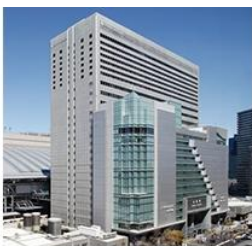
▶ HOTEL GRANVIA OSAKA