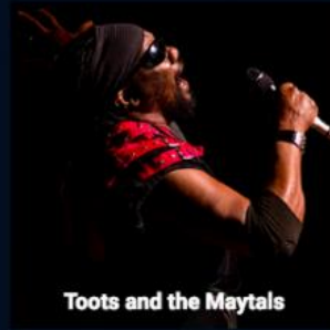
Toots and the Maytals