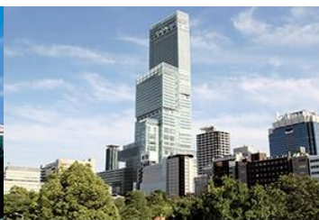
▶ OSAKA MARRIOTT MIYAKO HOTEL

ตั้งอยู่ใกล้แหล่งช้อปปิ้ง ใช้เวลาเดินเพียง 7 นาทีจากสถานี Hankyu Juso Station เป็นโรงแรมขนาดใหญ่ มีห้องพักกว่า 653 ห้อง และห้องอาหาร 4 ห้อง