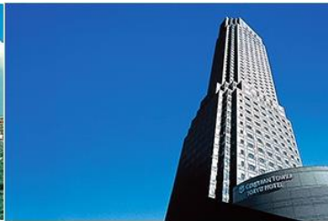
▶ CERULEAN TOWER TOKYU HOTEL

สามารถชมทัศนียภาพ Tokyo Sky Tree และสัมผัสกลิ่นอายสมัย Edo ย่าน Asakusa ได้