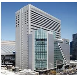
▶ HOTEL GRANVIA OSAKA