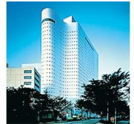
▶ SHINJUKU WASHINGTON HOTEL MAIN

พักผ่อน หย่อนคลาย ที่ใจกลางกรุงโตเกียว ย่าน Odaiba ห้องพักกว้างขวาง ตกแต่งหรูหรา มีบริการรถรับส่งไป-กลับ Tokyo Disney Resort