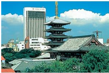
▶ ASAKUSA VIEW HOTEL