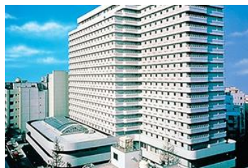
▶ HOTEL PLAZA OSAKA

เดินทางสะดวกสบาย ตั้งอยู่ในใจกลางเมืองอูเมดะ ติดกับสถานี JR Osaka Station