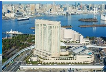
▶ GRAND NIKKO TOKYO DAIBA

ตั้งอยู่ใจกลางเมืองในย่าน Shibuya ห้องพักกว้างขวาง พร้อมทิวทัศน์ของเมืองจากมุมสูง เป็นหนึ่งในแลนด์มาร์คย่าน Shibuya