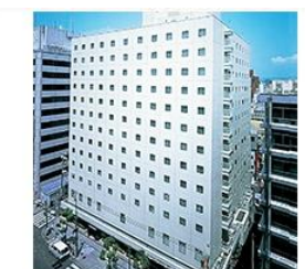
▶ OSAKA TOKYU REI HOTEL

ตั้งอยู่บริเวณชั้นบนของอาคาร Abeno Harukas ซึ่งเชื่อมต่อกับสถานีรถไฟ Tennoji Station