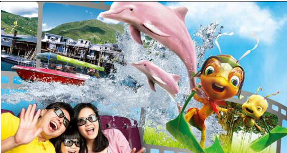
Motion 360 ภาพยนตร์ 5 มิติ วันธรรมดา 11.00 – 17.00 น. วันหยุด 10.00 – 17.30 น. ระยะเวลา 10 นาที