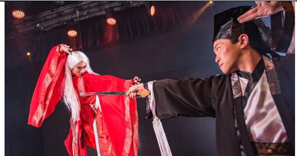
Stage 360 โชว์จากนักแสดงมืออาชีพ รอบ 12:00 13:30 14:15 15:00 15:45 16:30 ระยะเวลา 15 นาที