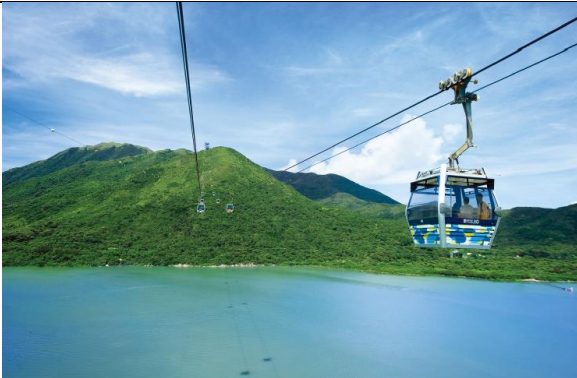
กระเช้านองปิง ไป-กลับ (Standard Cabin)