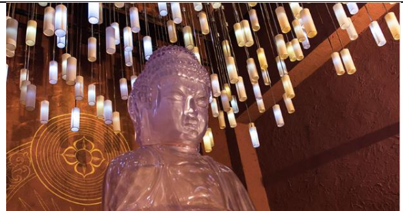
Walking with Buddha การแสดงมัลติมีเดียย้อนรอยเส้นทางการตรัสรู้ของ สมเด็จพระสัมมาสัมพุทธเจ้า