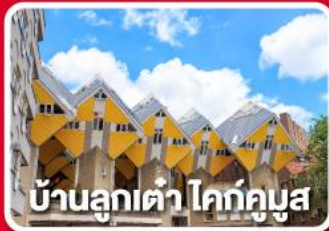
บ้านลูกเต่า โคกคึมูส