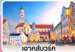
อาคส์บวร์ค