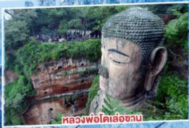
หลวงพ่อดเล่อซาน