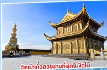
วัดเป่ากั๋วสวยงามที่สุดในจ้อไบ๊