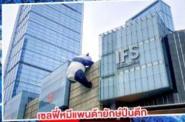
เซลฟี่หมีแพนด้ายักษ์ปิ่นคิง