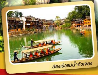
ล่องเรือแม่น้ำถิวเจีย