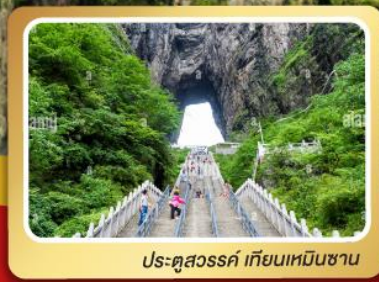
ประตูสวรรค์ เทียนเหมินซาน