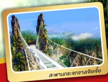
สะพานกระจกจางเจียเจีย

ฉางซา อุทยานจางเจียเจีย เมืองโบราณฟ่งหวง (นั่งรถไฟความเร็วสูง)