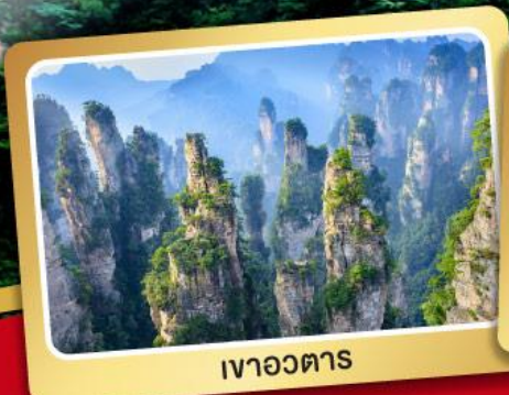
เวาอวตาร

เวาเจ็ดดาว อุทยานแห่งชาติจางเจียเจีย 5 วัน 4 คืน