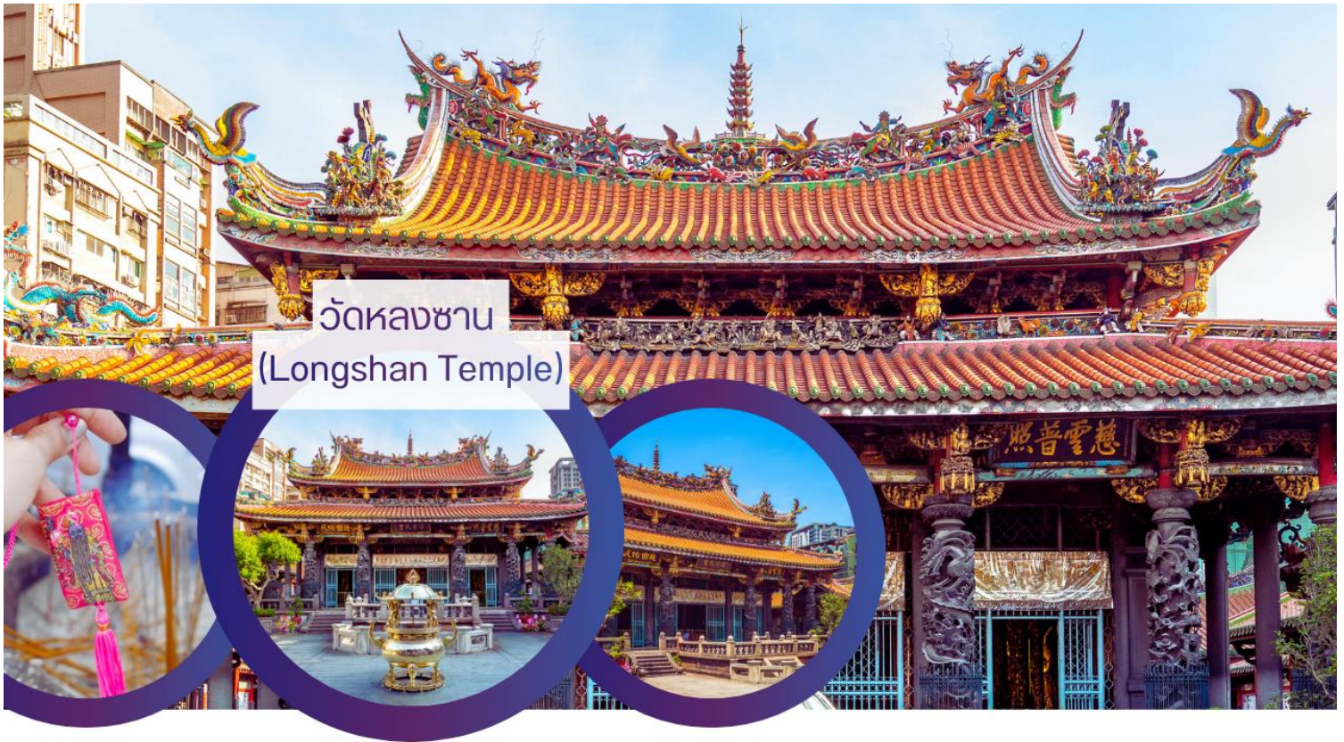
วัดหลงซาน (Longshan Temple)

ปิดท้ายค่ำคืนด้วยเดินเล่น ย่านซีเหมินติง (Ximending) เป็นย่านช้อปปิ้งและแหล่งบันเทิงยอดนิยมที่ตั้งอยู่ในเขตว่านฮวา นครไทเป ประเทศไต้หวัน ได้รับฉายาว่า "ฮาราจุกุแห่งไทเป" เนื่องจากเป็นศูนย์กลางแฟชั่นและวัฒนธรรมสมัยใหม่ของวัยรุ่นไต้หวัน