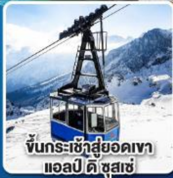
ขึ้นกระเช้าสู่ยอดเขา แอลป์ ดิ ซูสเซ่

เที่ยวเมืองอินส์บรุค เพชรเม็ดงามสุดโรแมนติก แห่งแคว้นทิโรล