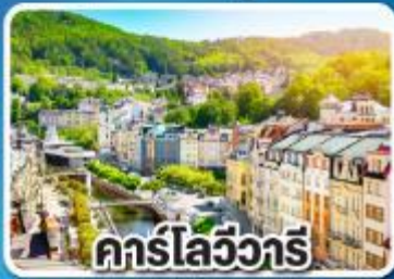
คาร์ลส์บวร์ค