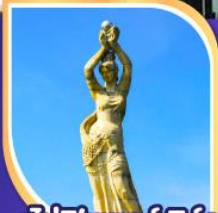
จูไห่พีซเซอร์กิส