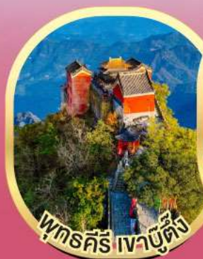
พุทธคีรี เจาบูตึง