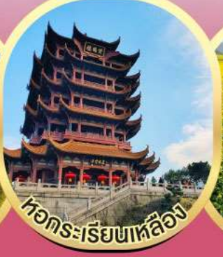
หอคระเรียนหลืออง