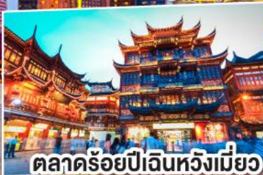
ตลาดร้อยปีเงินหวังเหมียว