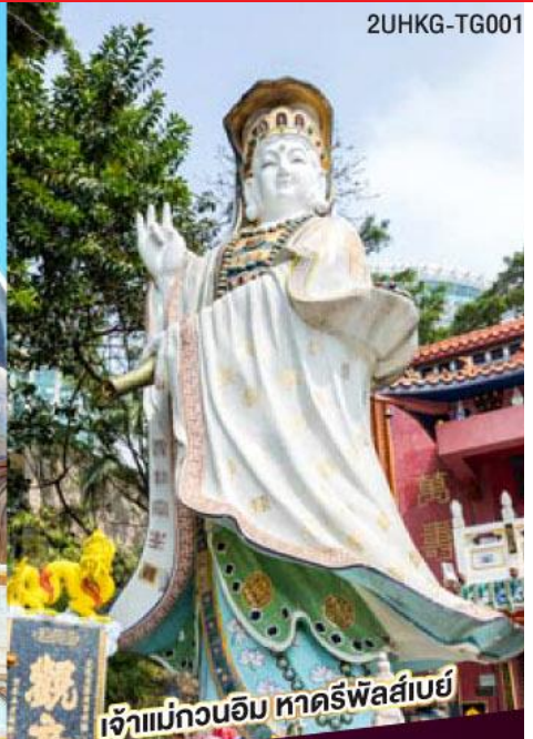
เจ้าแม่กวนอิม ทาครีพัลส์เบย์