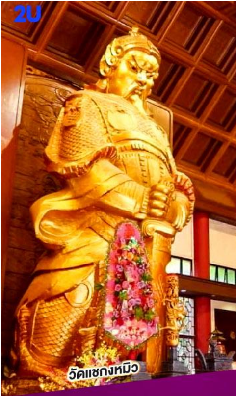
วัดแซงเหมียว