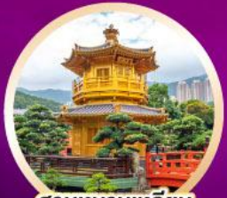
สวนหนานเหลียน วัดนางชีหลิน