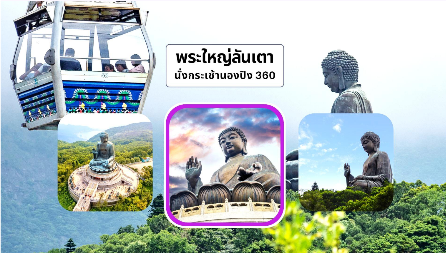
พระใหญ่ลันเตา นั่งกระเช้ามองปิง 360

เช้า รับประทานอาหารเช้า ณ ภัตตาคาร บริการท่านด้วยเมนูต้มยำฮ่องกง (มื้อที่ 4)