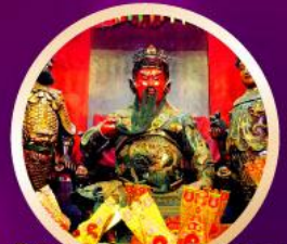
วัดกวนไท เทพเจ้ากวนอู