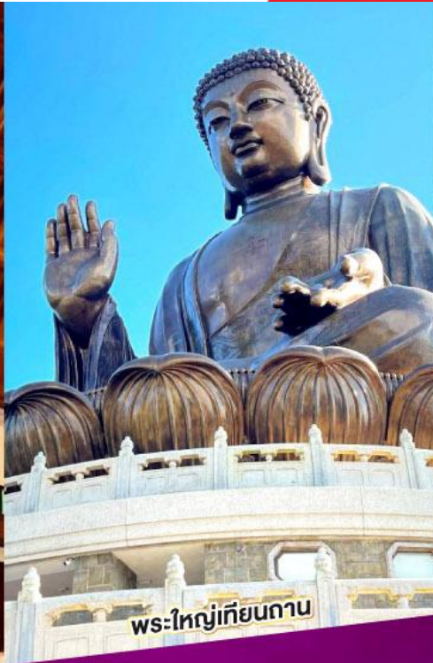
พระใหญ่เทียนกาน