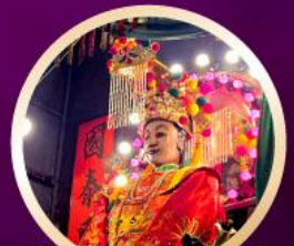
วัดเจ้าแม่กิมกิมทิว