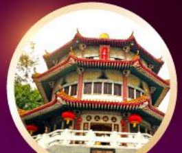
วัดหวนหวน