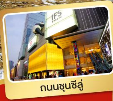
ถนนชุนชี่