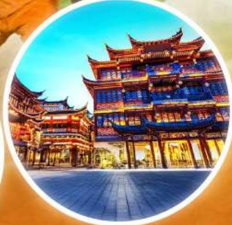
ตลาดร้อยปีเฉิงหวังเหมียว