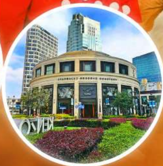
Starbucks ใหญ่ที่สุดในโลก