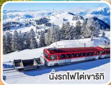
นั่งรถไฟใต้เขาริกิ

เข้าชมปราสาทนอยชวานสไตน์ ต้นแบบปราสาทเจ้าหญิงนิทรา