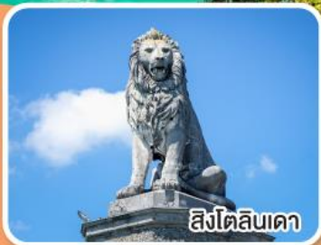
สิงโตลินเดา