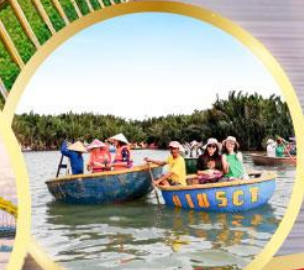
เรือกระดิ่ง