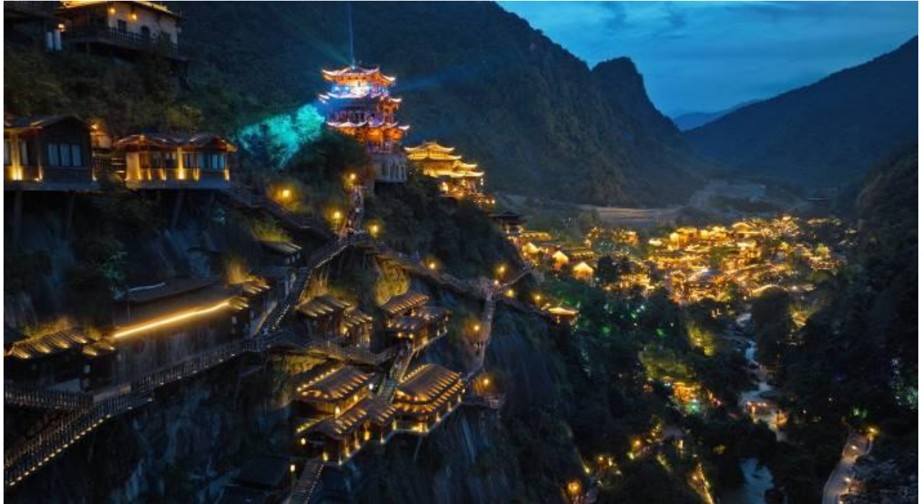
ที่พัก SHANGRAO NEW CENTURY GUANTANG HOTEL หรือเทียบเท่า 5 ดาว (มาตรฐานจีน)