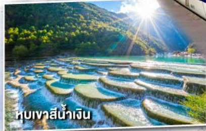
หุบเขาสีน้ำเงิน