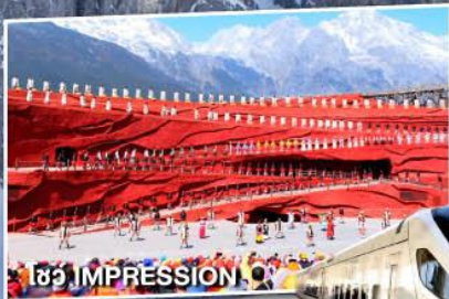
โชว์ IMPRESSION O