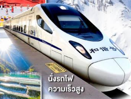
นั่งรถไฟ ความเร็วสูง