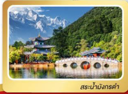
สระน้ำมิงกรต้า