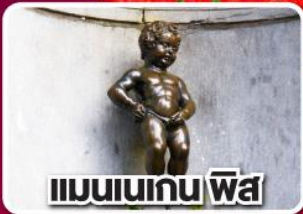
แมนเนเกน ฟิส