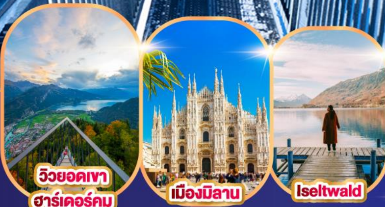
วิวยอดเขา ฮาร์เดอร์คุม