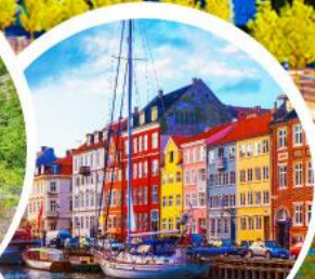
ท่าเรืออ่าววัน.โตปเปนเฮเกน