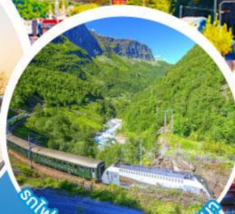
รถไฟสายโรแมนติกฟลัมสบานา