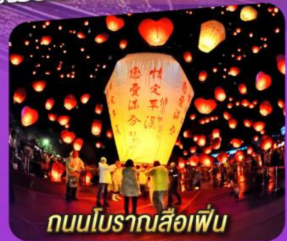
ถนนโบราณส่องฝัน