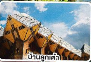
บ้านลูกคำ