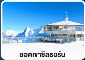
ยอดเขาซิลลอร์ดน

เข้าชมความสวยงาม พระราชวังเฮเรียนเคียมเซ "แวร์ซายน์แห่งเยอรมนี"