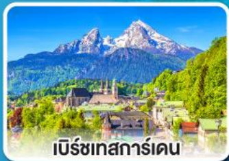
เบิร์ชเทสการ์เดน