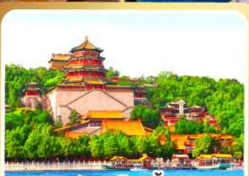
พระราชวังฤดูร้อนอี่เหอหยวน