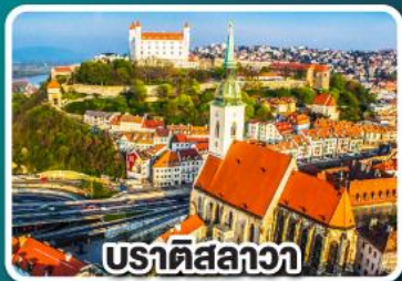
ปราตีสลวา