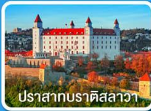
ปราสาทบราติสลาวา