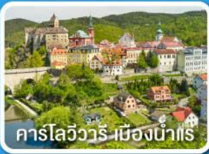
คาร์โลวัวร์-เมืองน้ำแร่

เยอรมนี เชก สโลวัก ฮังการี ออสเตรีย 8 วัน 5 คืน