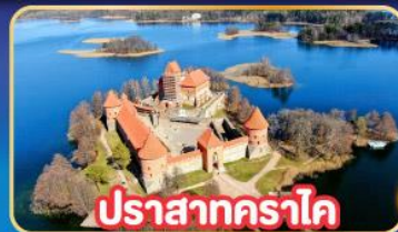
ปราสาทคราโด

พิเศษ! เที่ยวเก็บครบทุกประเทศยุโรปเหนือ ลิทัวเนีย , ลัตเวีย , เอสโตเนีย , ฟินแลนด์