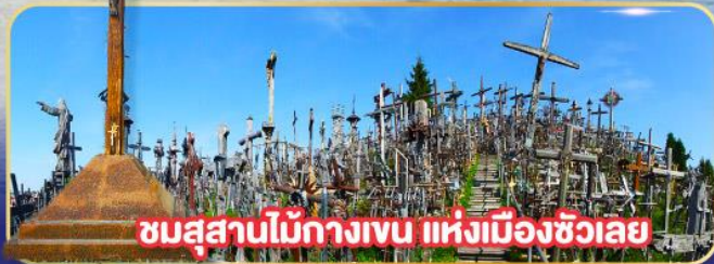
ชมสุสานไม้กางเขน แห่งเมืองซิวเลย์