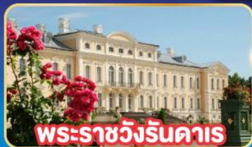
พระราชวังรินดาร์