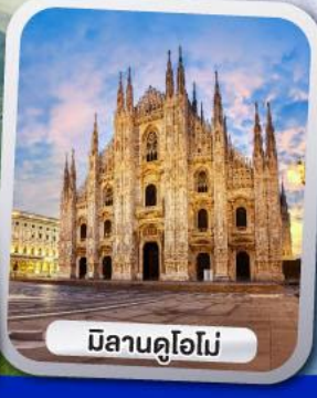
มิลานคูโอโม

✓ ขึ้นกระเช้าหมุน 360 องศา ชมวิวแบบพาโนรามาของยอดเขาทิตลิส