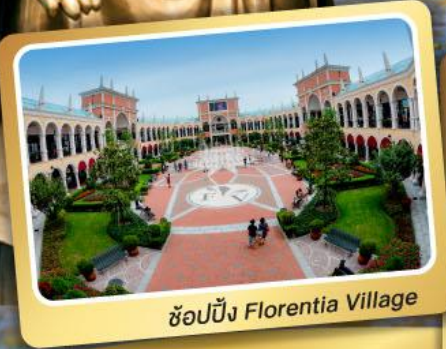
ช้อปปิ้ง Florentia Village

เซี่ยงไฮ้ อุ๋ซี ซูโจว หังโจว 6 วัน 4 คืน