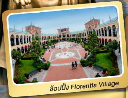
ช้อปปิ้ง Florentia Village