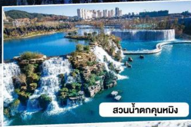
สวนน้ำตกคุณหมิง