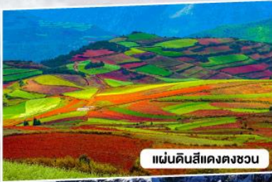
แผ่นดินสีแสดตงชวน