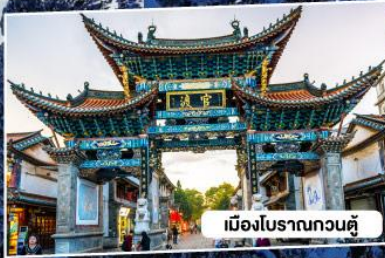
เมืองโบราณกวนตุ๋