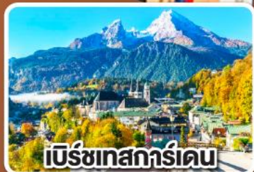
เบิร์ชเทสการ์ดเดน

เข้าชมเมืองกล็อบบราเดน แห่งเมืองเบิร์ชเทสการ์ดเดน