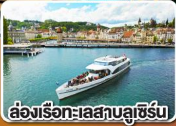
ล่องเรือทะเลสาบลูซิิร์น