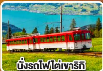
นั่งรถไฟใต้เขาเทริท